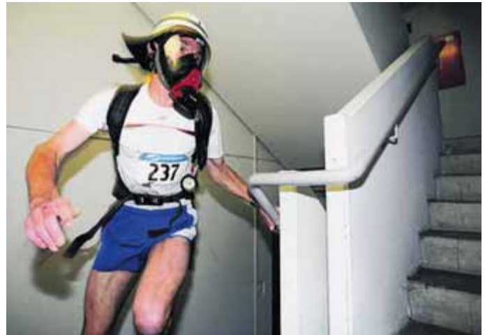
In voller Montur

Für den Hochzoller, der schon Weltrekorde im 12- und 24-Stunden-Treppenlaufen aufgestellt hat, war die Strecke schlichtweg zu kurz. Die schnellste Frau in 2:13 Minuten hieß Christine